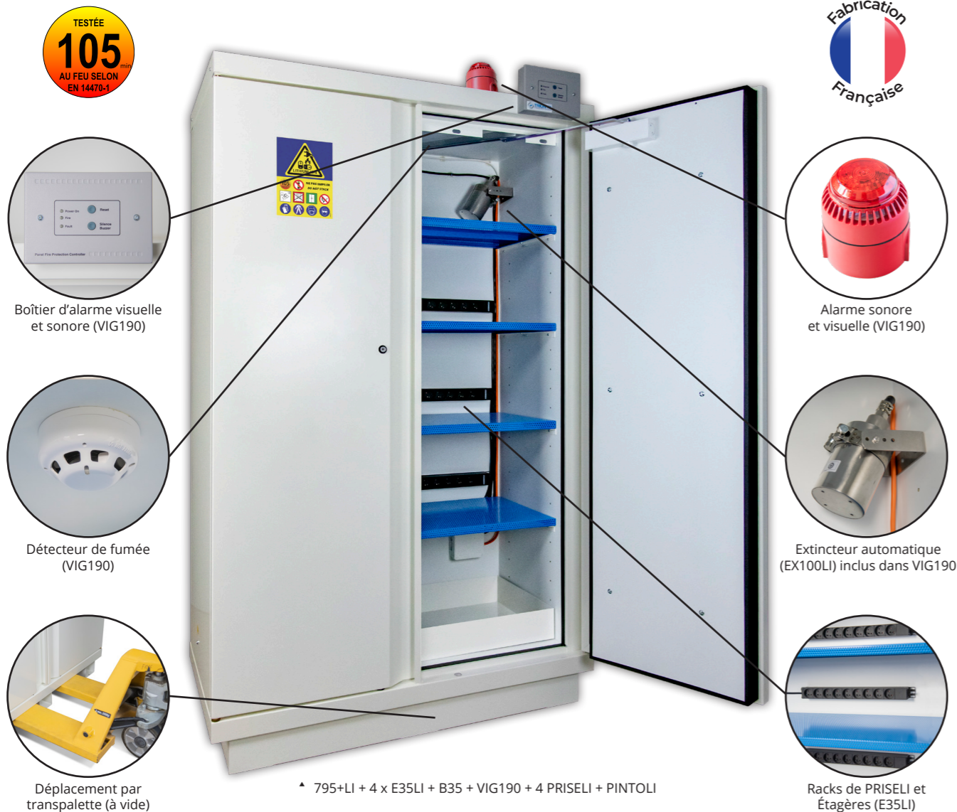
Boîtier d'alarme visuelle et sonore (VIG190)