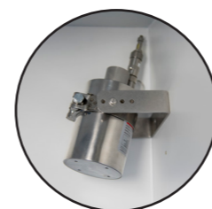
◀ Extincteur automatique à ampoule 79°C (EX100LI)